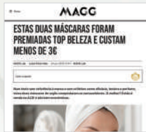
Artigos Branded Content