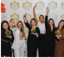
Entrega de Prêmios