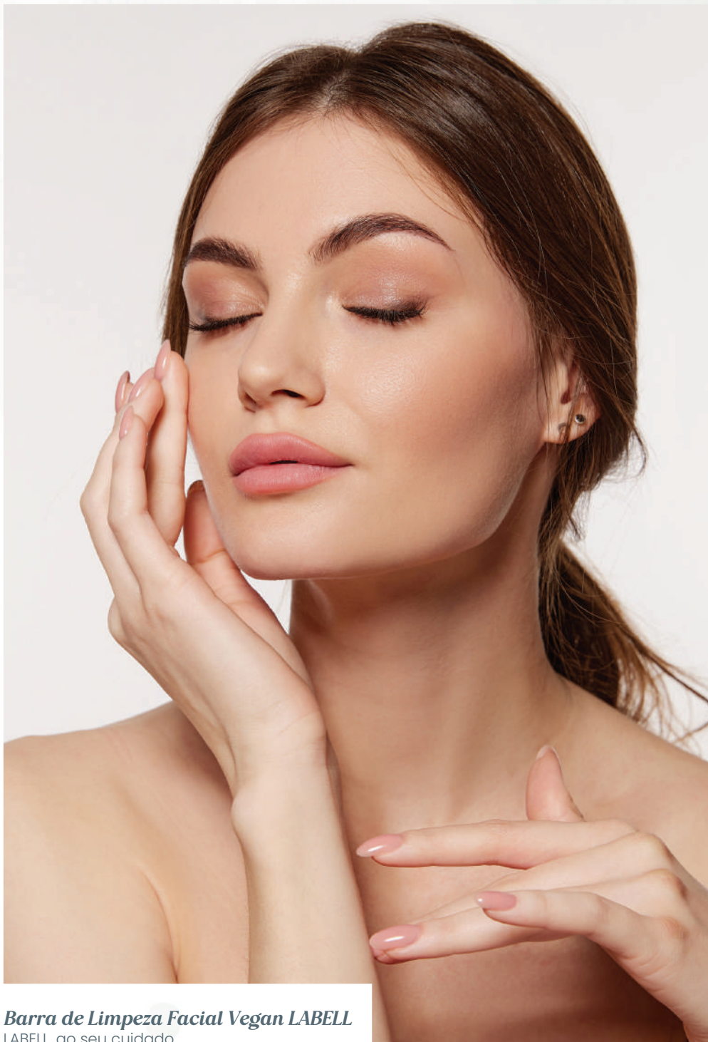
Barra de Limpeza Facial Vegan LABELL LABELL, ao seu cuidado.