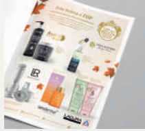
Publicidade em Imprensa Especializada