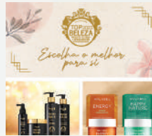
Content Display Advertising