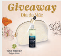
Ativação Redes Sociais